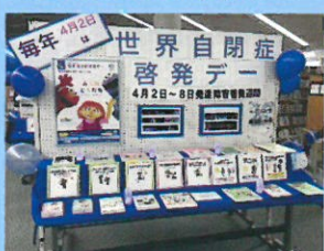
過去のイベントの様子