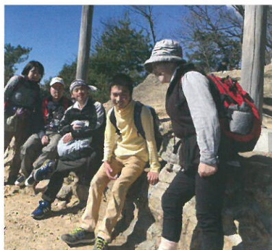
移動支援でみんなで日和田山に登りました

日中一時 生活サポート 有償運送 移動支援…映画、ボーリング、 カラオケ、プール等